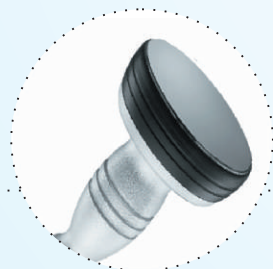
D80 - tratamente zone de dimensiuni extinse