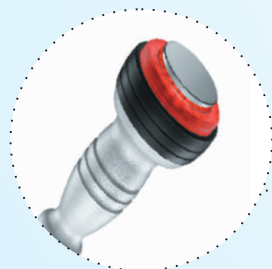
D60 - tratamente zone de dimensiuni reduse